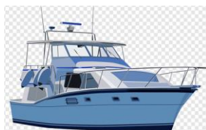
BIENES E INVERSIONES